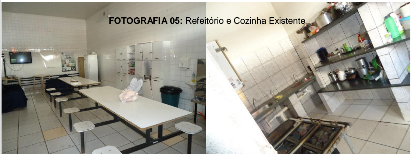
FOTOGRAFIA 05: Refeitório e Cozinha Existente