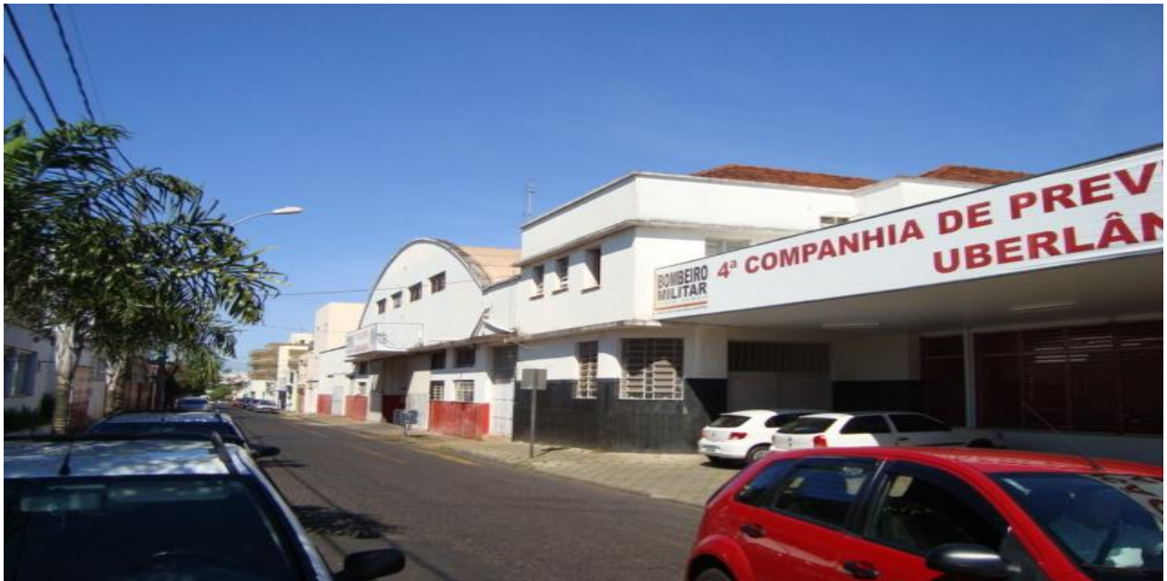
FOTOGRAFIA 02: Fachada do 2ª Pelotão dos Bombeiros Militares de Uberlândia