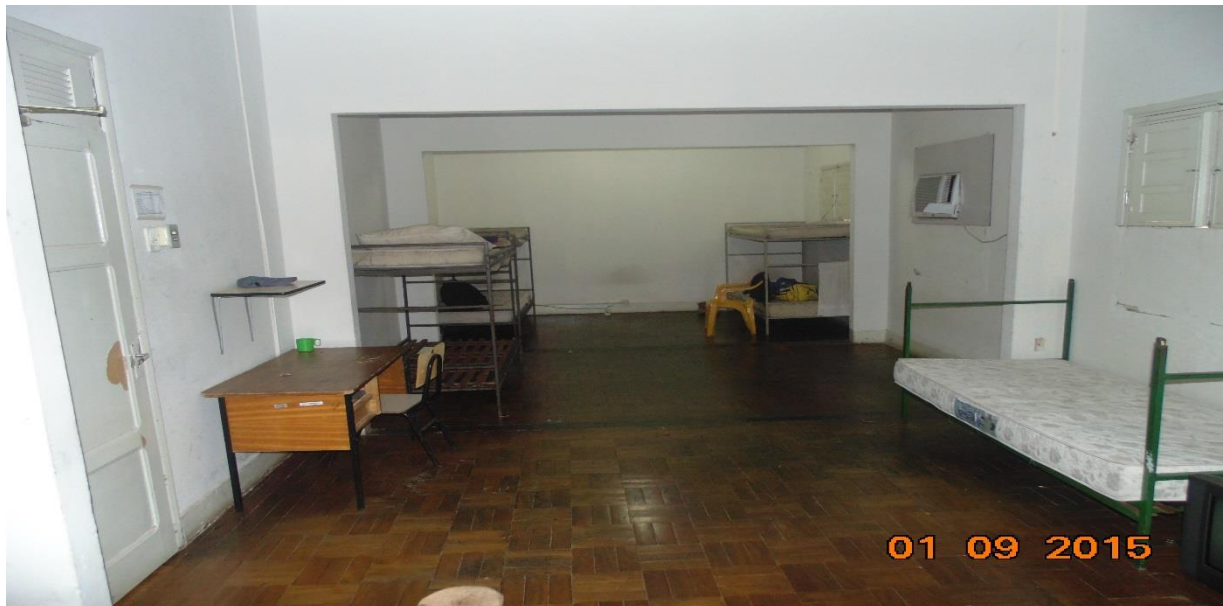
FOTOGRAFIA 10: Alojamentos corpo de bombeiros – Pavimento superior

Reforma Previstas: Troca de piso, demolição de alvenaria, nova porta para acesso ao novo sanitário, repintura de paredes e esquadrias.