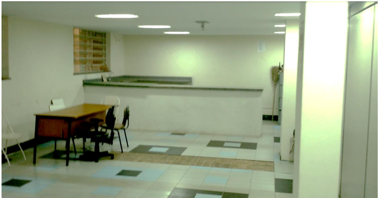
FOTOGRAFIA 06: Refeitório – Pavimento Térreo