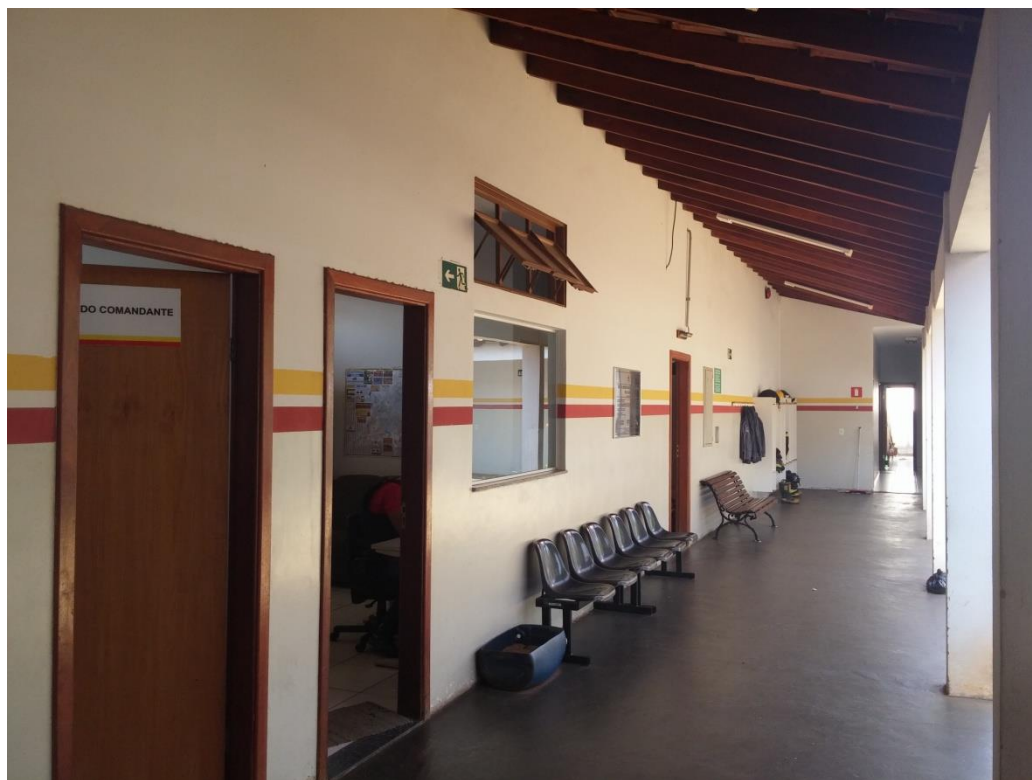
Adaptações para alojamento SAMU