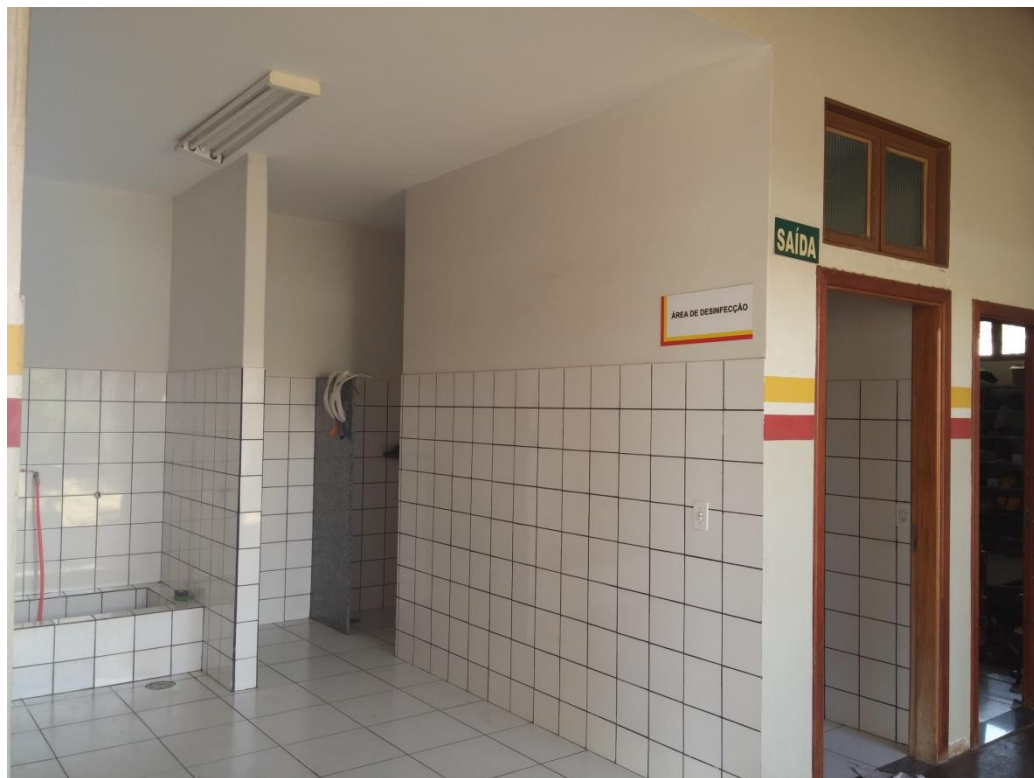
FIGURA 04: Sala de desinfecção de equipamentos