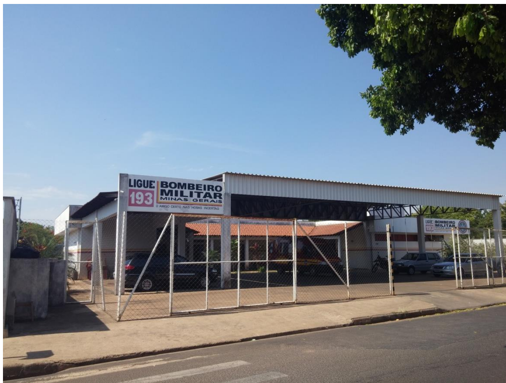
FIGURA 02: Fachada da Edificação

Pintura e adaptação para mídia visual e disposição de vaga para ambulância.