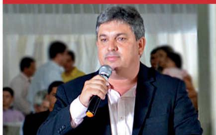
Leandro Luiz de Oliveira Pres. Amvap e prefeito de Ipiaca